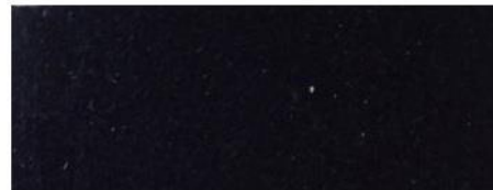
Kuva 2 Sopiva näytemäärä A. Pölynäytteen määrä liian suuri B. Pölynäytteen määrä sopiva C. Pölynäytteen määrä liian pieni