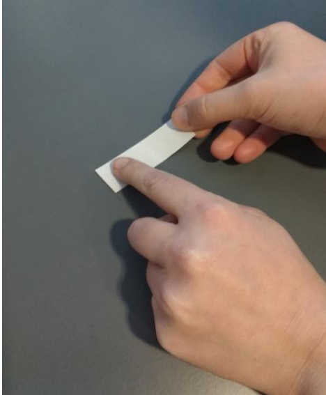
Kuva 1 Näytteenottotekniikka Paina teippi venyttämättä tutkittavaa pintaa vasten. Tarkasta tarttuneen pölyn määrä. Mikäli pölyä ei ole tarpeeksi, paina teippi uudelleen pintaa vasten